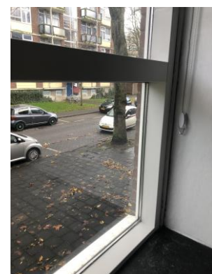
Woning met nieuw kozijn